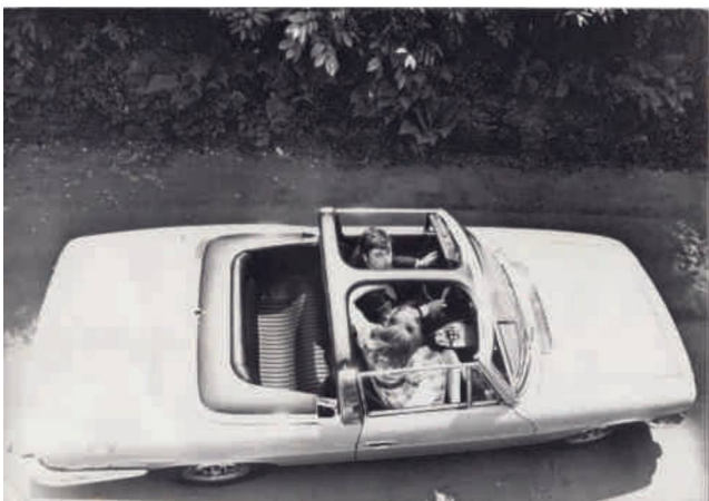
Franse introductie foto Stag 10 juni 1970